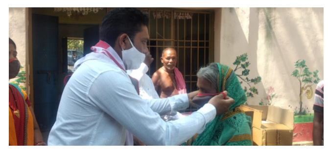
We are grateful to all our major Donors

(Aramco, Aviva & Nestle) and Volunteers for their generous support for IRCS relief efforts on behalf of the millions of underprivileged and vulnerable families struggling to survive in the aftermath of the COVID-19 Pandemic and other disasters. Thank you for your compassion, patience and contribution.