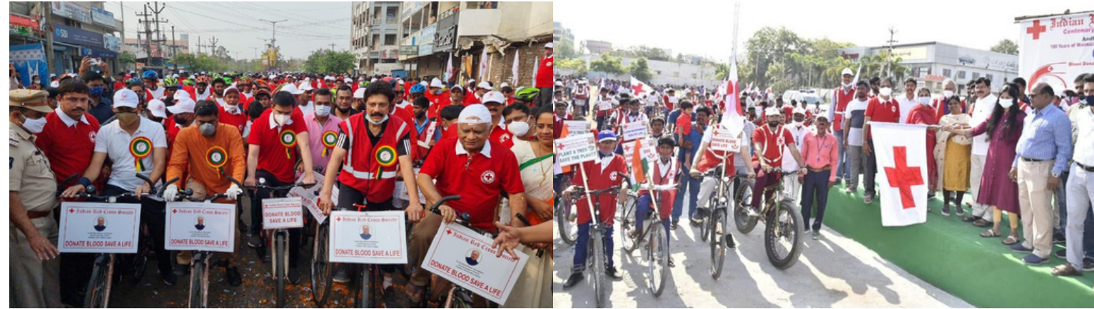
More than 4,000 students participated in a 'Red Cross Centennial Cycle Rally', which was held in Nellore, Andhra Pradesh. Other than the Nellore rally took place at Srikakulam, Chittoor, Kurnool, Anantapur, and Kadapa districts of Andhra Pradesh.