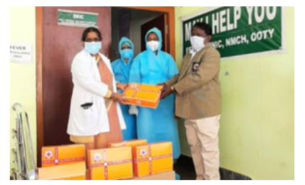
Hygiene Kits distribution-Nagaland