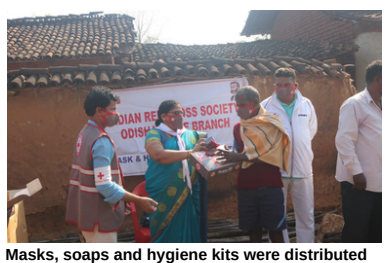
wasks, soaps and nygiene kits were distributed amongst villagers of the Kutra Sundargarh district of Odisha