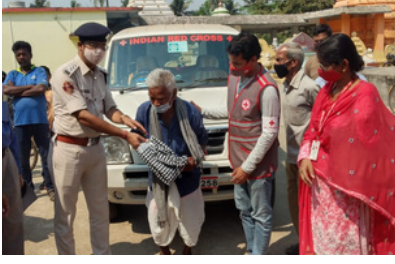
Distribution of mosquito nets, tarpaulins to the needy villagers of Nagari Village , Phul Nakhara, Cuttack.Odisha

(Aramco, Aviva & Nestle) and Volunteers for their generous support for IRCS relief efforts on behalf of the millions of underprivileged and vulnerable families struggling to survive in the aftermath of the COVID-19 Pandemic and other disasters. Thank you for your compassion, patience and contribution.