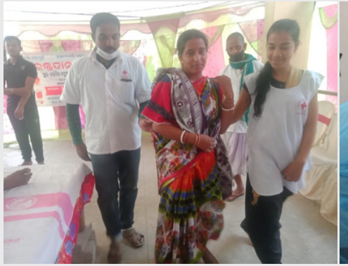
Blood donation at Balibil Red Cross Shelter, Odisha