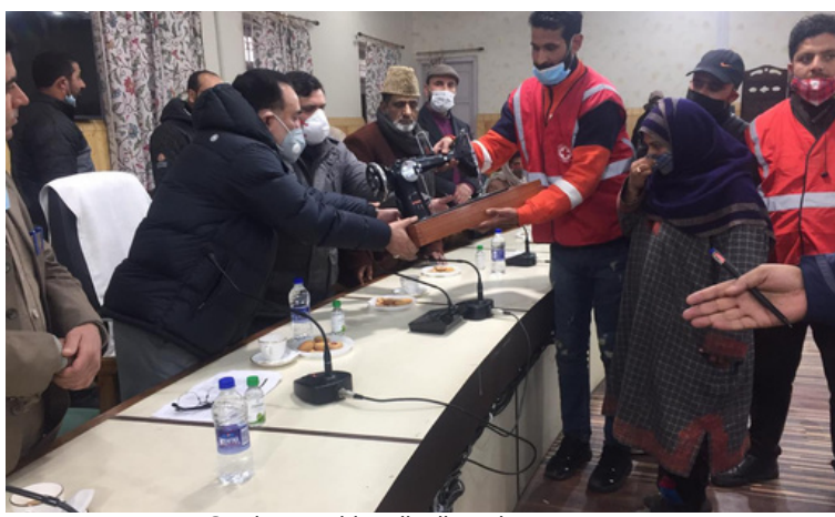
Sewing machine distributed among 27 beneficiaries in district of Kupwara, J&K