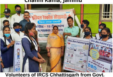
Volunteers of IRCs Chartisgarn from Govt. Higher Secondary School Khartuli, Dhamtari, conducted an awareness program on Covid-19 vaccination.