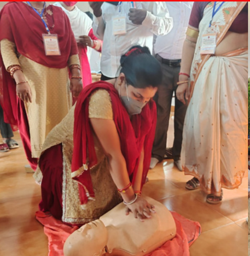
First Aid Training was held at JRC Counsellors Training Programme Khordha District, Odisha