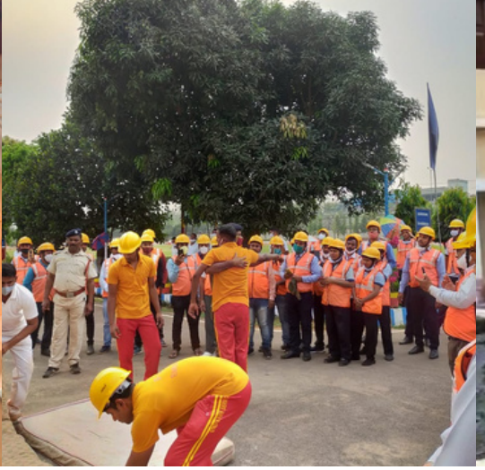
Fire Safety and Rescue training by fire officers to the participants of JRC Counsellors Training Programme at Khordha District of Odisha.