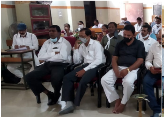
JRC Counsellors' Training Camp at Bhadrak District, Odisha