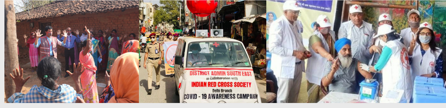
Awareness session on hand hygiene-Odisha