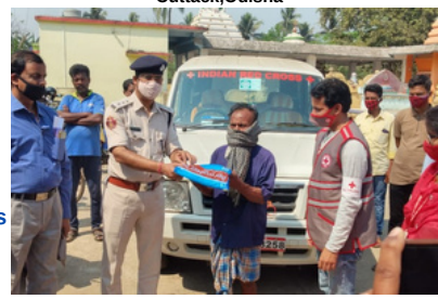
Distribution of mosquito nets, tarpauline to the needy villagers of Nagari Village , Phul Nakhara, Cuttack,Odisha