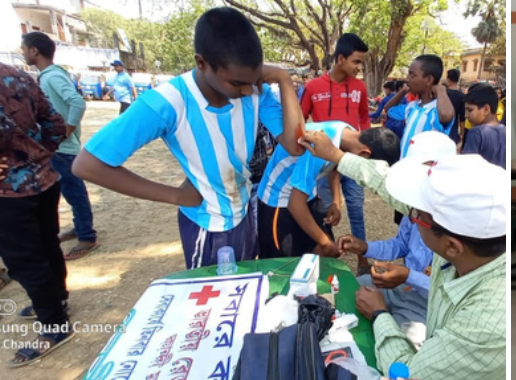
First Aid Post organized by IRCS Kandi SD-Branch,Odisha