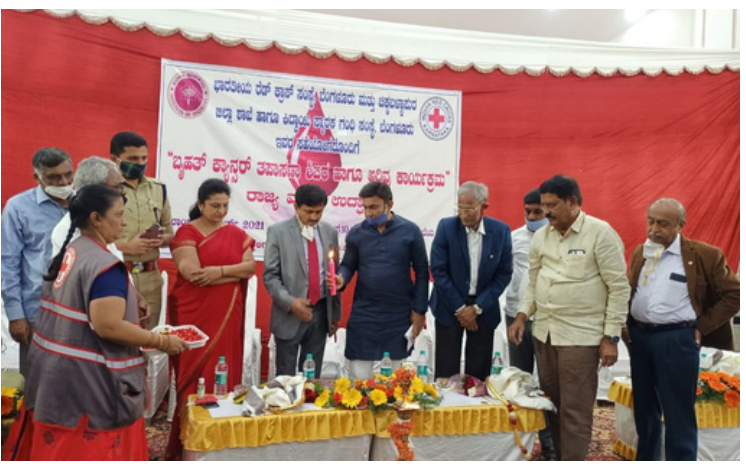
The Indian Red Cross Society, Karnataka State Branch, in partnership with the IRCS Chikkaballapura District Branch and the Kidwayi Cancer Hospital in Bengaluru, organized a comprehensive cancer awareness campaign in Chikkaballapura District on 6th March 2021.