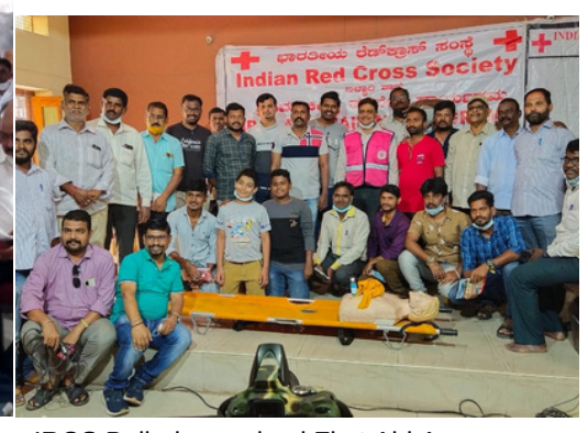
IRCS Ballari organized First Aid Awareness to all Media Persons of Ballari, Karnataka