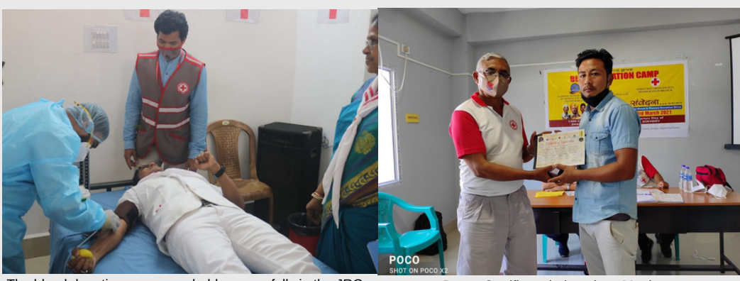
The blood donation camp was held successfully in the JRC Training camp at Sundargarh District