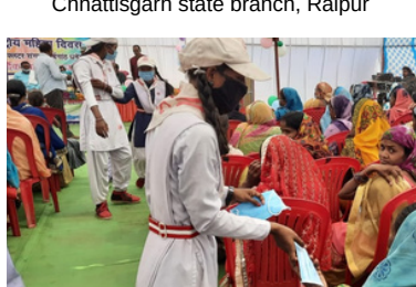
Distribution of Masks by JRC volunteers-Kanker branch, Chhattisgarh